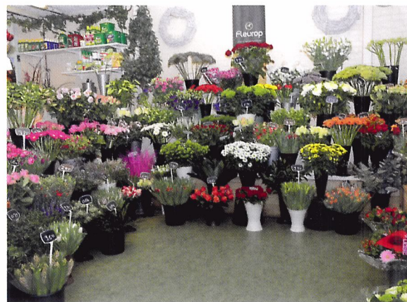
Afb. 1.71 Een presentatie van snijbloemen op kleur en lengte geeft rust en bevordert de verkoop.

Als de snijbloemen in de vazen staan, presenteer je ze in de winkel. Als ze allemaal door elkaar staan, is de presentatie niet aantrekkelijk. Daarom rangschik je de bloemen op kleur en lengte. Er ontstaat dan rust in de presentatie. Dat staat mooier en je verkoopt meer. Voor het presenteren van een nieuwe levering maak je de presentatiehoek leeg en helemaal schoon. Sorteert dan de bloemen op kleur. De langste van dezelfde kleur plaats je achteraan, de kortste vooraan. Zorg er wel voor dat je alle bloemen goed kunt pakken.