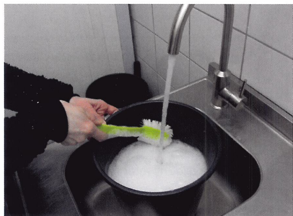
Afb. 1.69 De binnenkant van een snijbloemenvaas moet schoon en bacterievrij zijn voordat je de snijbloemen erin zet. Daarom maak je de vazen schoon met een borstel en milieuvriendelijk schoonmaakmiddel.

Als de snijbloemen van de kweker in de winkel komen, moet je ze uitpakken en in vazen zetten. Maar voordat je dat kunt doen, maak je de snijbloemenvazen schoon. De binnenkant van de vaas moet namelijk schoon en bacterievrij zijn. Dan blijven de snijbloemen langer mooi. Je maakt de vazen schoon met een borstel en milieuvriendelijk schoonmaakmiddel. Let op: sommige schoonmaakmiddelen kunnen vlekken in je kleding veroorzaken. Spoel de vaas goed na met water. Maak ook de buitenkant schoon. De schoongemaakte vazen zet je, apart van de vuile vazen, in de binderij (bij de werkplek) klaar.