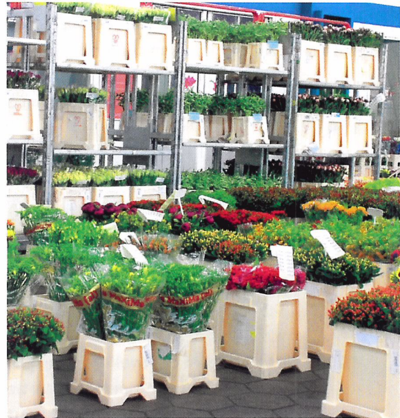
Afb. 1.67 Snijbloemen zijn tijdens transport verpakt in plastic of papier. Ze worden vervoerd in emmers of in dozen.

Voordat snijbloemen in de winkel staan, moet er heel wat gebeuren. Snijbloemen zijn levende producten. Daarom behandel je ze anders dan bijvoorbeeld diervoeder. Je leert hoe je snijbloemen verkoopklaar maakt als ze van de kweker, de veiling of de groothandel komen. Als je dat weet, kun je het ook zelf doen.