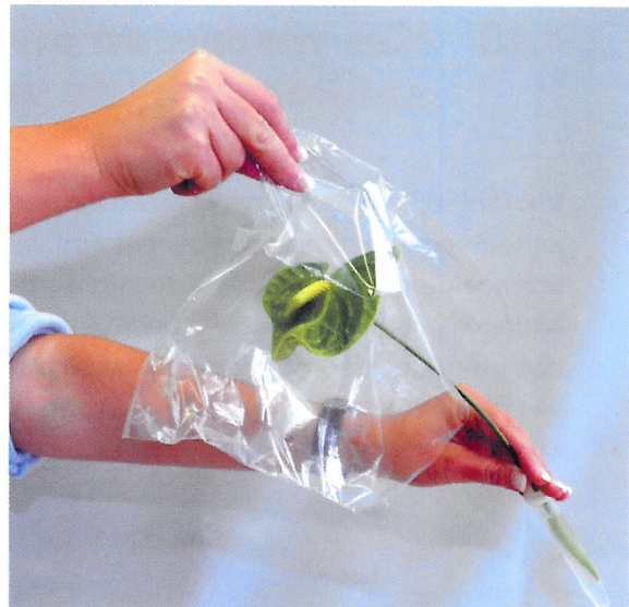
Afb. 1.68 De kweker verpakt extra kwetsbare snijbloemen per stuk. De steel zit in een steekbuisje met water.

De kweker pakt de snijbloemen in om beschadiging tijdens het vervoer te voorkomen. Dat kan op verschillende manieren. Vaak vervoert de kweker snijbloemen in een plastic hoes. Met vijf of tien bossen staan ze dan in een emmer met water. Extra kwetsbare bloemen, zoals anthuriums en orchideeën, worden per stuk in een doos verpakt en vervoerd. Ze hebben een steekbuisje om de steel.